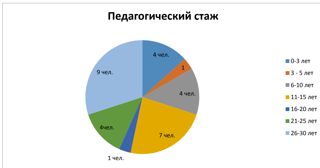
Диаграмма 1. Стаж работы педагогов ЧДОУ «Детский сад «ЖАРКИ»

В 2020 учебном году образовательный процесс в ЧДОУ «Детский сад «ЖАРКИ» осуществляли 30 педагогов, всего работников 53. Соотношение воспитанников приходящихся на 1 педагога- 4/1; на всех работников 2/1.